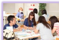
【在学生とのフリートーク】