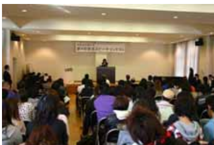
スピーチコンテスト